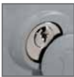
clé de déverrouillage